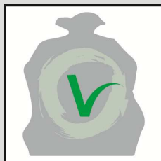
Vadec SA (sacs NEVa)